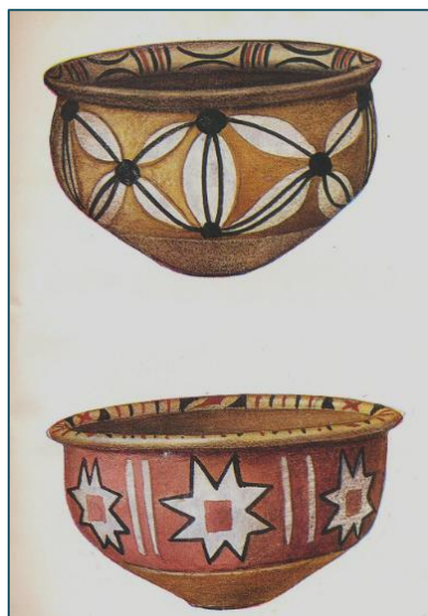
Привозная керамика из Дадуньцзы

особенности местного исторического процесса, по-прежнему остаётся актуальным для современного китаеведения» [2, с. 39]. В книге «История культуры Китая» М. Кравцова предлагает использовать для периодизации цивилизационный подход. «С позиций цивилизационного подхода Китай определяется в качестве одного из генетически автономных цивилизационных очагов народов мира» [2, с. 33]. История Китая рассматривается масштабными фазами: «1) Архаический Китай (с раннего палеолита и до возникновения государственности); 2) Древний Китай , объединяющий период ранних государств (эпохи Шань-Инь, XVII – XI вв. до н. э., и Чжоу X – III вв. до н. э.) и период ранних империй (эпохи Цинь и Хань, III в. до н. э. – III в. н. э.); 3) Традиционный Китай (III в. – 1912 г.); 4) Современный Китай (с 1912 г.), за начало которого предлагается принять дату отречения от власти последнего китайского императора и установления в Китае республиканской формы правления» [2, с. 39-40].