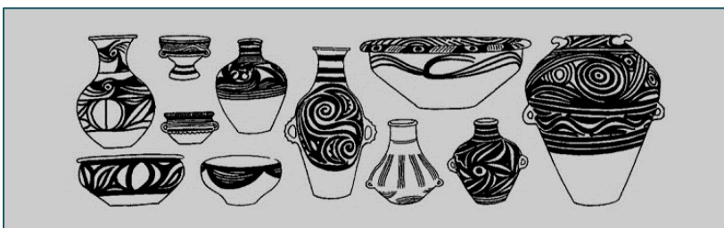
М.Е. Кравцова. «История культуры Китая» [2, С.42]

Китайский учёный Фань Вэнь-Лань писал: «Земледелие занимало важное место в общественном производстве. При раскопках обнаружено много каменных топоров, которые применялись в сельском хозяйстве. Большинство стоянок расположено в долинах рек, где почва плодородна и удобна для земледелия. Стоянка в дер. Сиипь (уезд Сясань провинции Шаньси) простирается с востока на запад на 560 м и с юга на север – 800 м с четырёх сторон стеной прямоугольные ямы, напоминающие жилища. Эти жилища тесно примыкают друг к другу, образуя поселение. Если бы жители этого поселения не занимались земледелием, они не могли бы вести оседлый образ жизни. Скотоводство также являлось важной отраслью хозяйства. Среди яншаоских находок много костей животных, причём больше всего костей свиней, есть также кости лошадей и быков. Разведение значительного количества свиней тоже свидетельствует об относительной устойчивости поселений того времени» [6, с. 18].