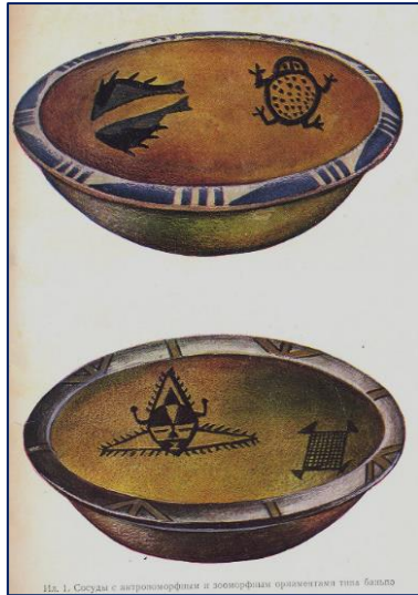
Сосуды с антропоморфными и зооморфными орнаментами

около 40 категорий изделий, набор и формы которых широко варьируют в отдельных региональных гончарных традициях. Самые заметные различия между ними наблюдаются для керамики яншаоских культур, с одной стороны, и южных, юго-восточных и восточных культур, с другой. Художественными видами неолитических сосудов являются расписная и монохромная керамика, украшенная соответственно росписями и различными разновидностями рельефного орнамента. Ареал распространения расписной керамики приходится на культуры Яншао. Тогда как в южных, юго-восточных, восточных и северо-восточных культурах устойчиво преобладают монохромные изделия» [2, с. 43–44].