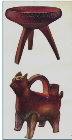
Сосуды из Дадуныцзы (вверху) и Давэнькоу (внизу)